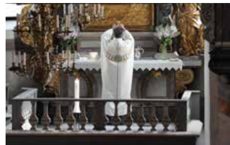
Vitt är färgen under högtidsdagarna.

När sedan själva julen bryter in är det den vita färgen som gäller. Märk väl att julen i kristen mening egentligen börjar först på juldagen, den 25 december. Julaftonen handlar ursprungligen om en glädjefylld förväntan inför det stora mysteriet som enligt traditionen ägde rum på natten, då herdarna på marken först av alla fick veta vad som hänt. Ingen vet när på året Jesus föddes, men man valde att placera festen vid midvintersolståndet. Dels handlar det om en koppling mellan himmel och jord – precis som ljuset så sakteliga börjar återvända efter årets längsta natt firar man det eviga ljuset i Jesu person. En annan anledning var att Kyrkan ville göra den uråldriga, hedniska midvinterfesten kristen. Hos oss här i Norden ersatte den det som kallades midvinterblotet, som på sina håll till och med innebar det blodiga offrandet av människor. Julskinkan, liksom en del annan traditionell nordisk julmat, är en kvarleva från vår hedniska forntid.