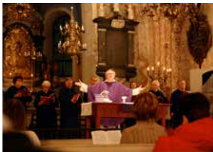
Under adventsfastan är prästens kläder lila.

Med första advent börjar kyrkan sitt nya år. Om vårt liv som människor ses som en linje mellan födelse och död är kyrkoåret närmast att likna vid ett kugghjul som har ambitionen att anknyta till hela det mänskliga livets höjd-, bottenpunkter och allt däremellan. Redan i Kyrkans begynnelse var påsken den centrala högtiden som fick firas i lönnedom eftersom förföljelsen av de kristna från Romarrikets sida med varierande intensitet pågick