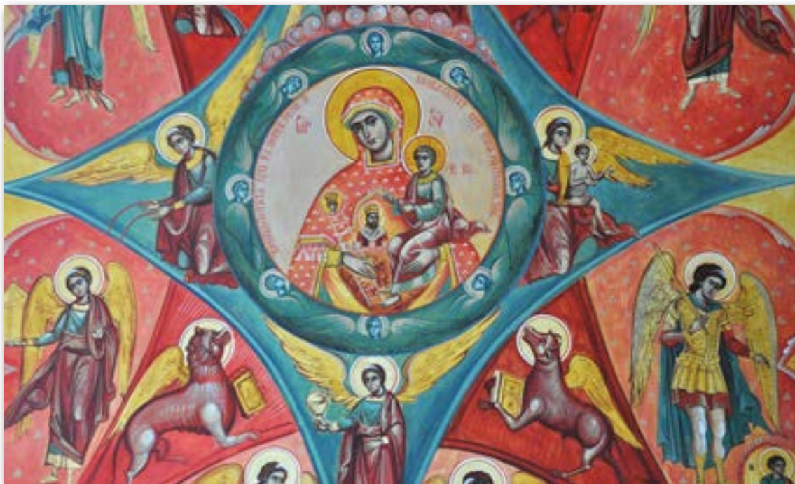
Mariabild från Antimklostret, Bukarest