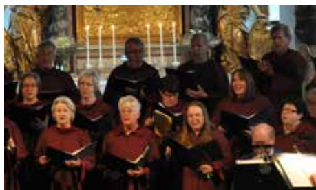
Ösmo-Torö kyrkokör vid första advent

Jag har sjungit i kyrkokör sedan tonårstiden, och det känns som en självklarhet att det ska finnas en kyrkokör på plats vid de stora högtiderna. Vad är Första Advent om jag inte får sjunga ”Dotter Sion” i högmässan och höra sången klinga i kyrkovalven?