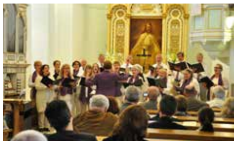
Kyrkokören i Bukarest 2014