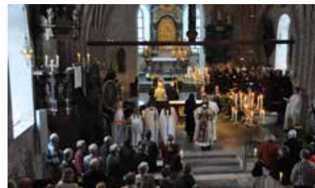
Kyrkokören som en del av gudstjänsten

se av något större, av Guds närvaro, av att vi alla är del av en ofattbar helhet. De valda körstyckena förstärker och ger nya dimensioner av de ord som har lästs och predikats i gudstjänsten. Psalmsången blir brusande och stark när det finns en kyrkokör som kan klämma i lite extra, och det gör att jag som gudstjänstdeltagare vågar sjunga ut mer och också kan få del av de ”feel good”-hormoner som frigörs när man sjunger i kör. Som gudstjänstdeltagare får jag höra musik som jag aldrig har hört förut och sådant som är kärt och välbekant.