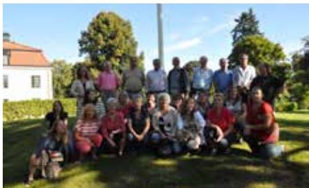
Körhelg på Hagaberg 2013

gruppen och körklngen, så körens ”sound” utvecklas ständigt. Det är viktigt att det finns en tillströmning av nya körsångare som vill vara med!